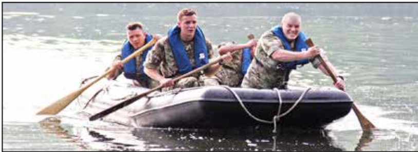
● Team 609 West Riding Squadron RAF, Team 1 during the rubber dinghy exercise