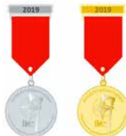
Medal for every participant, Competitors golden, supporters silver.