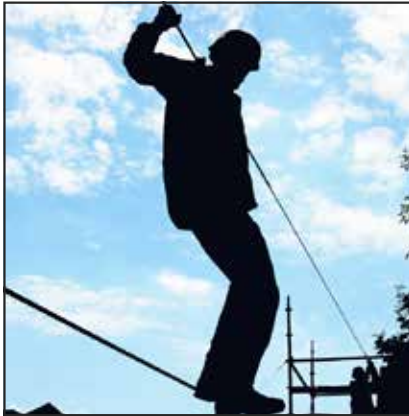
● An IMM participant on the assault course