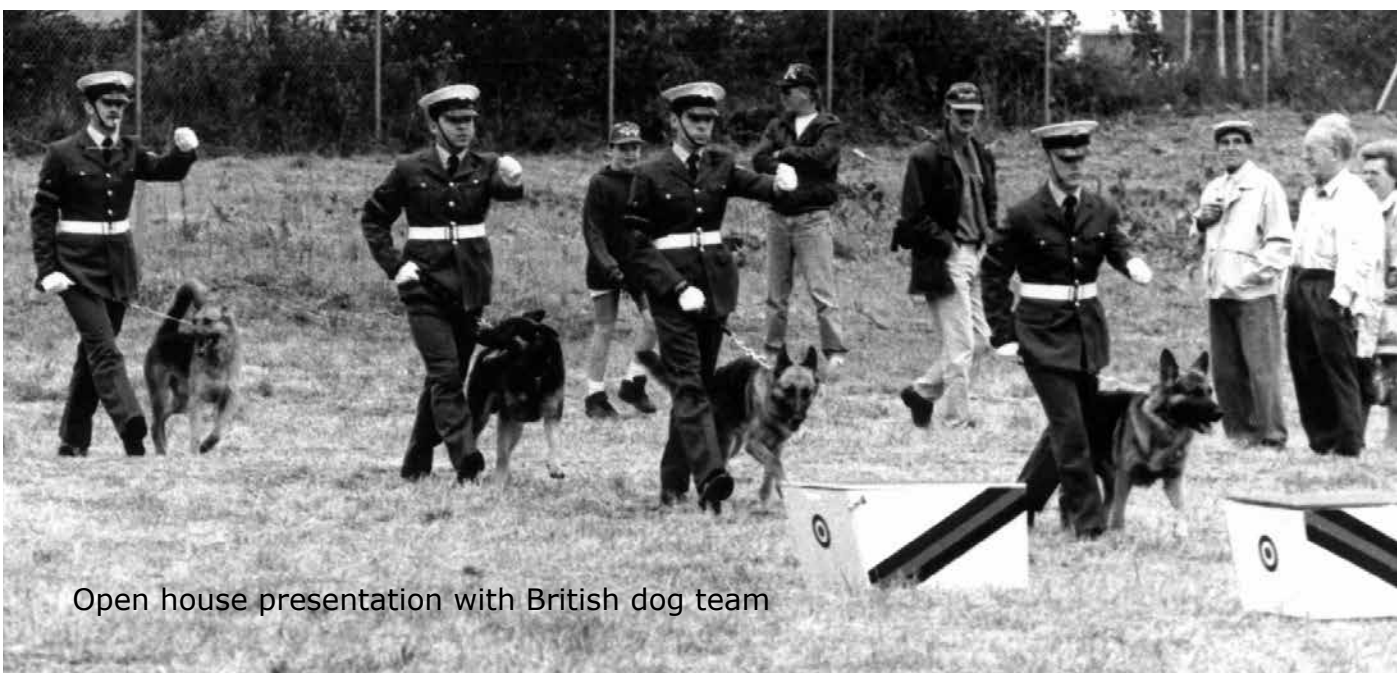
Open house presentation with British dog team

Generalleutnant Hans-Heinrich Dieter. Ein weiteres "besonderes Vorkommnis" war 1990 der Besuch der letzten offiziellen NVA-Delegation in der Geschichte der DDR (auf Vermittlung des Bundesverteidigungsministeriums). Es kam zu bewegenden deutschdeutschen Szenen. Es war schon ein Hauch Geschichte, als ein vom offiziellen Feindbild geprägter DDR-Offizier unter Tränen bekannte, erst hier habe er eine „echte Volksarmee“ kennengelernt. Das Jubiläum 25 Jahre IMM wurde 2008 mit 18.000 Zuschauern im Rahmen des 25. NATO-Musikfestes gefeiert. In diesem Jahr werden es 36 Jahre IMM sein.