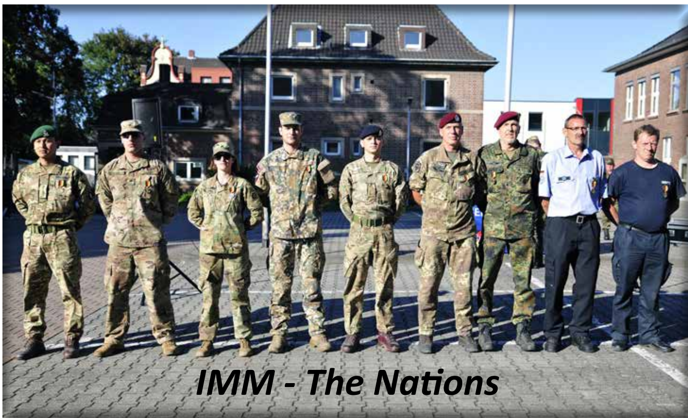
IMM - The Nations

Wenn Sie nicht einverstanden sein sollten, dass Sie abgebildet werden, teilen Sie dies vor dem Start bitte unbedingt der Leitung mit. Anderenfalls gehen wir davon aus, dass Sie gegen die eventuelle Veröffentlichung Ihres Bildes im Rahmen des IMM keine Einwände haben. Vielen Dank für Ihr Verständnis!