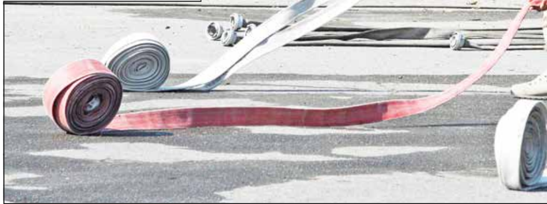
● The Defence School of Policing and Guarding, Portsmouth, during a team event

A TEAM from Mongolia was the surprise guest at a NATO competition held in Mönchengladbach.