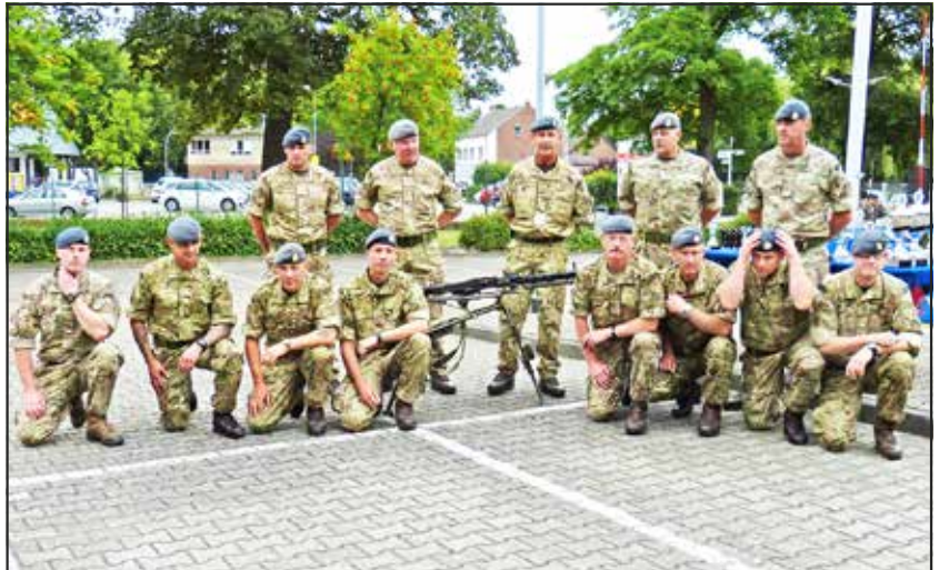
● 609 West Riding Squadron RAF Team II, from North Yorkshire